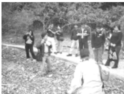
大家一起來上親子生態研習課