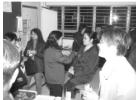
小息時間，家長彼此分享學習心得