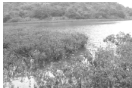
土瓜坪海灣，一大片紅樹倚岸而生