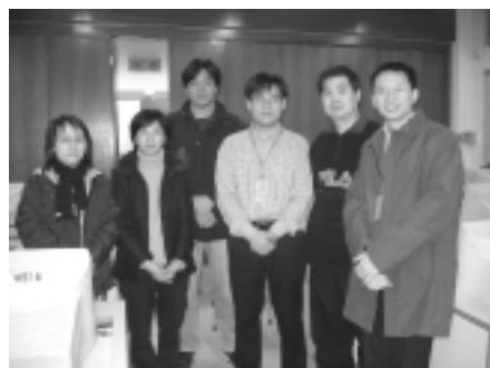
數碼相機使用班同學合照