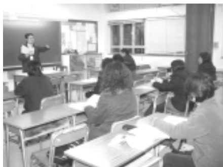
實用普通話班上課情況

為了與時並進，本會於二、三月為家長會員開辦了實用普通話班、英語會話班及數碼相機使用班。報名情況十分踴躍，出席的家長積極學習，十分投入。他們的學習態度實為同學的榜樣。