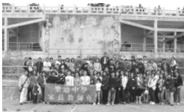
於佛堂門大廟外合照