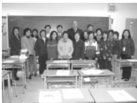
英文會話班同學來一個大合照