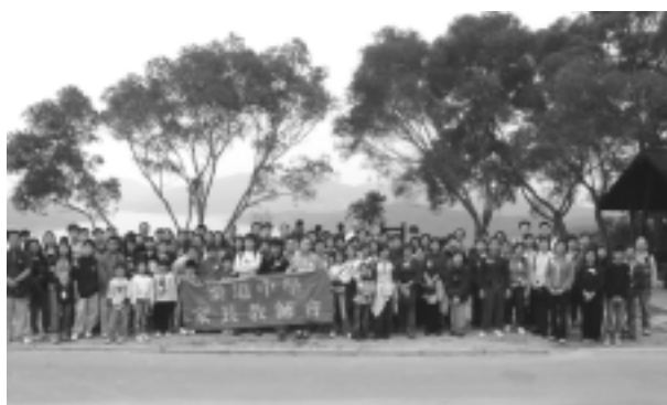
於萬宜水庫西壩合照